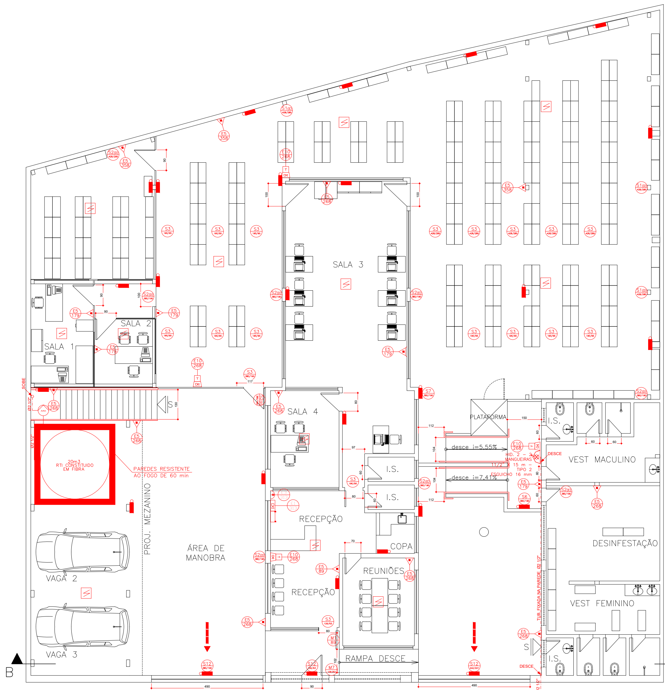
PLANTA PAVTO TÉRREO ESCALA 1:100 ÁREA 738,18m²